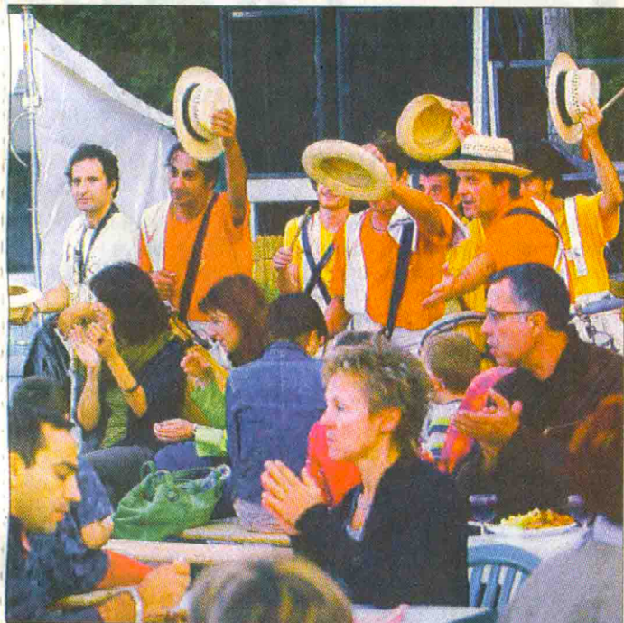
Jazz en Touraine Chambray-les-Tours (37)

Booking : Hugues Julien hugues.ago@orange.fr 06 50 10 40 99