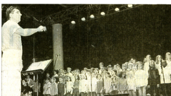
Les élèves du primaire ont travaillé avec l'ensemble La Comparsita dans le cadre de sa résidence 2006-2007.

L'orchestre du lycée Rabelais de Chinon, le Latin Rablay's Gang, a ouvert le troisième festival de cuivres de Chambray, vendredi soir, dans une salle Yves-Renaud bien remplie !