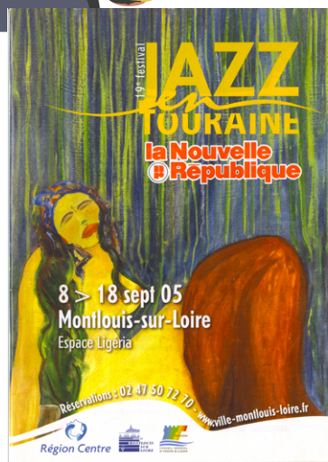
Jazz en Touraine #19 Montlouis-sur-Loire

« La Comparsita et ses rythmes cubains ont enflammé les rues de Ligueil ! »