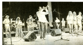
Le Latin Rablay's Gang, seul orchestre lycéen de salsa en France.