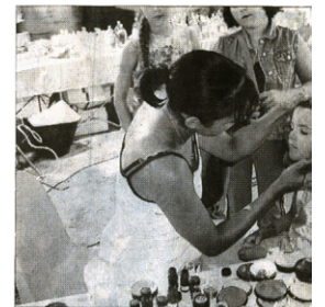
Séance de maquillage.

Sur des airs de musique cubaine et portoricaine, les villageois ont passé une agréable soirée lors du marché nocturne à Château-la-Vallière, samedi dernier.