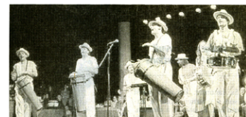
La Comparsita a clôturé la soirée sur des rythmes et chants cubains.

Place ensuite aux enfants des écoles primaires Claude-Chappe, Paul-Louis-Courier et Jean-Moulin, et aux élèves des classes de