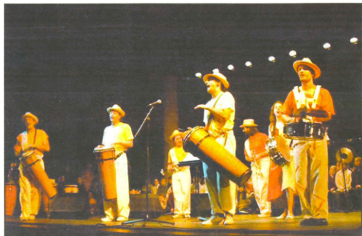
Voyage musical et ensoleillé avec La Comparsita.

MASTERCLASS ET ANIMATIONS PÉDAGOGIQUES L'ensemble est un habituel du genre : il s'engage même sur des résidences à l'année comme ce fut le cas, l'an passé, à Chambray-lès-Tours, avec les élèves des écoles primaires. Les écoles de musique des quatre communes ont aussi partagé l'univers sonore à l'atmosphère jazz de La Comparsita. Au programme, s'il vous plaît, l'étude des sonorités des musiciens