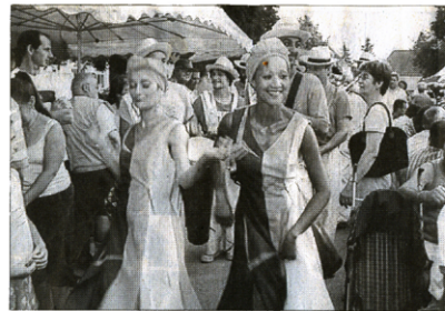
La Comparcita a emballé la foule.

Une soirée très, très chaude dans l'air et en musique !