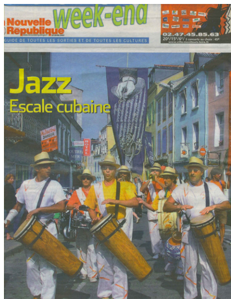
Jazz Escale Cubaine Tours (37)